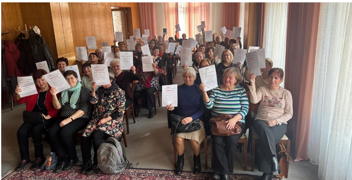
Předání diplomů absolventům Univerzity třetího věku